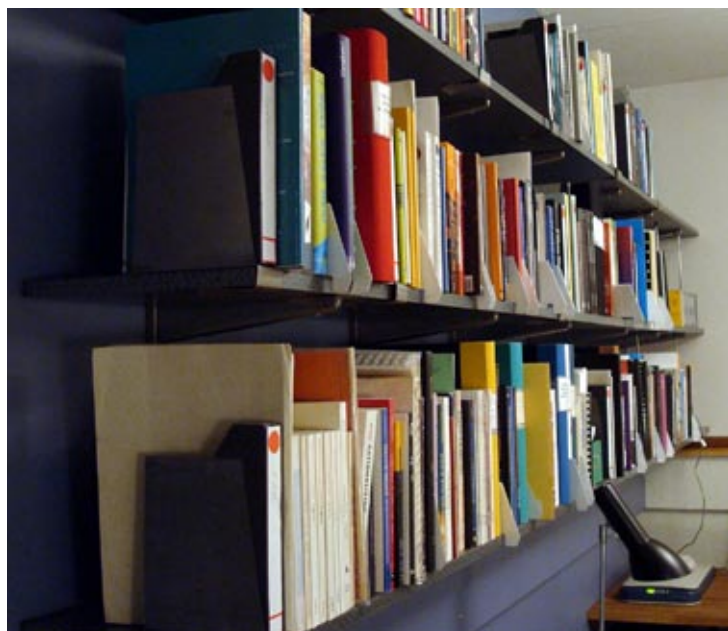
Från biblioteket.

I biblioteket finns ca 350 böcker inom ämnesområdena EAM, ljudkonst, datormusik, text-ljudkomposition, akustik, ljudteknik m.m. på svenska, engelska, franska, tyska och flera andra språk. Efter att ha legat i träda under flera år växer samlingarna nu relativt snabbt. Vi katalogiserar på en relativt enkel nivå och klassificerar inte enligt SAB eller Dewey, utan använder ett eget system som utvecklas medan biblioteket växer.