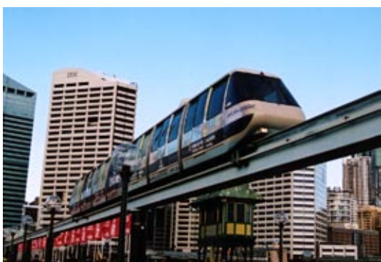
Monorail i Darling Harbour, Sydney.