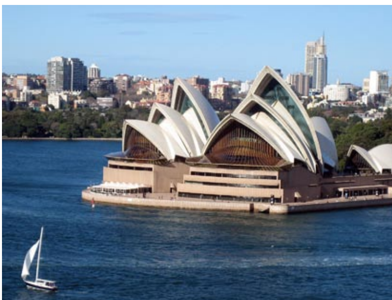
Vy över operahuset, Sydney Harbour.