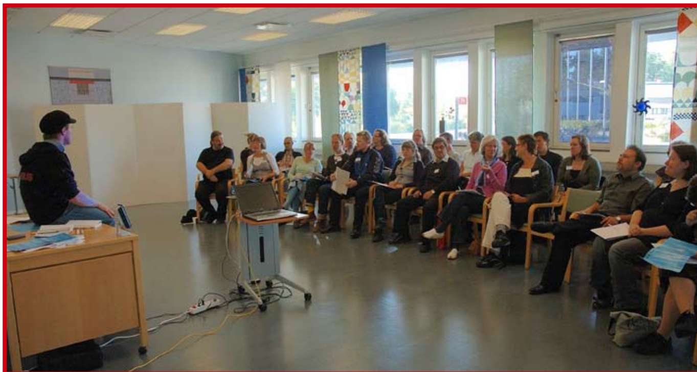
Från demotekskonferensen.

välutrustad bokningsbar inspelningsstudio. Man kan även ha datorer och program för att bearbeta bild, film, text, layout. Ungdomar vill inte bara konsumera kultur, man vill göra kultur också.