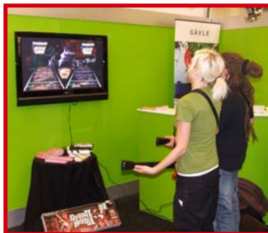
I Musikbiblioteket i Gävles monter kunde man prova på Guitar Hero.