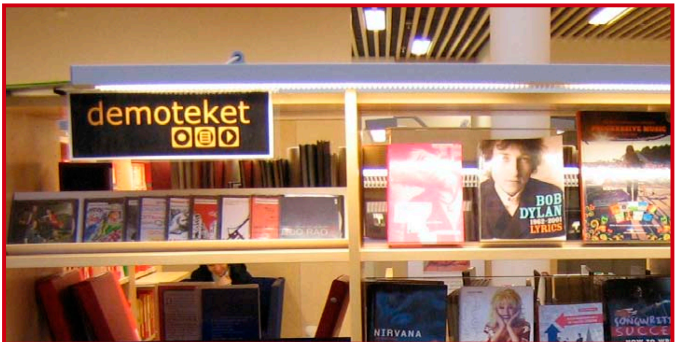
Lyssningsstationer och demoteket på Kungälv's stadsbibliotek.

går ju förlorad om vi inte får vara med och göra urvalet. Tänk om vi skulle få alla böcker skickade till oss också och det slutar med att alla bibliotek har precis samma utbud, hemska tanke.