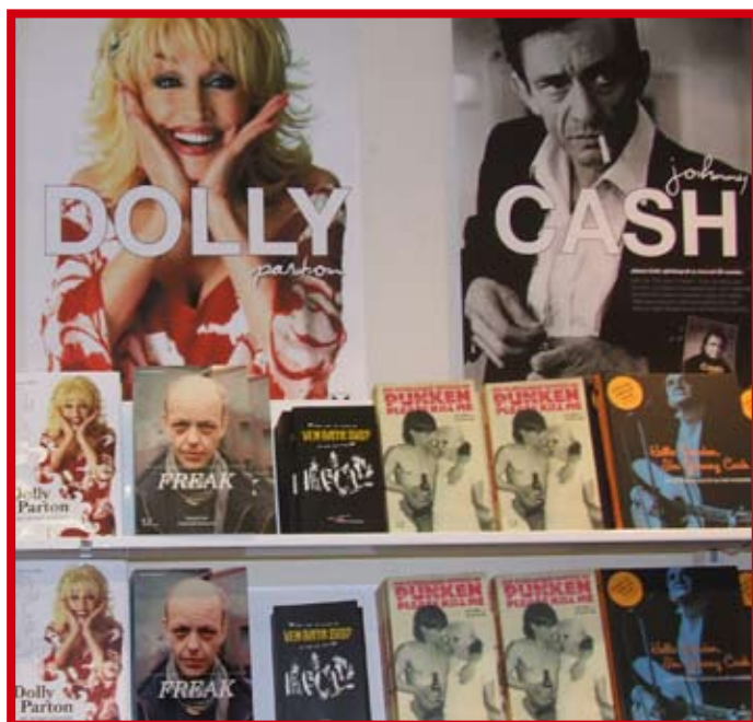
Från en monter på Göteborgs bokmessa.