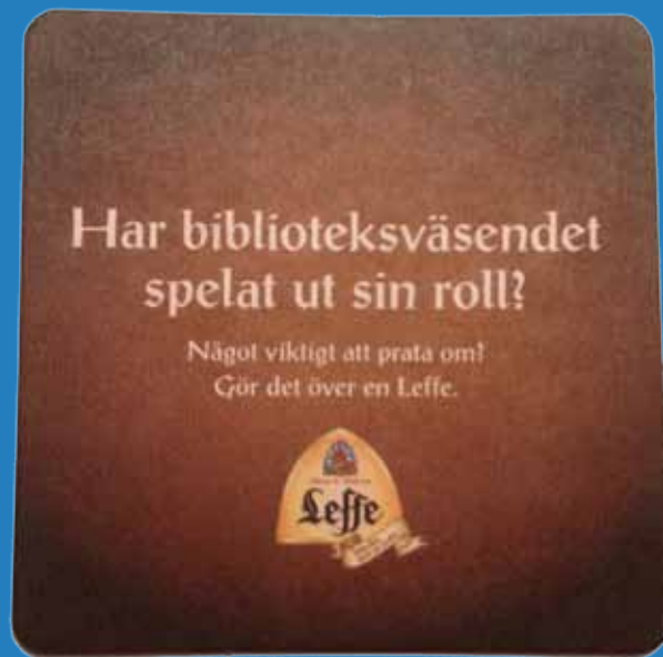
Debattinlägg - Ölunderlägg.