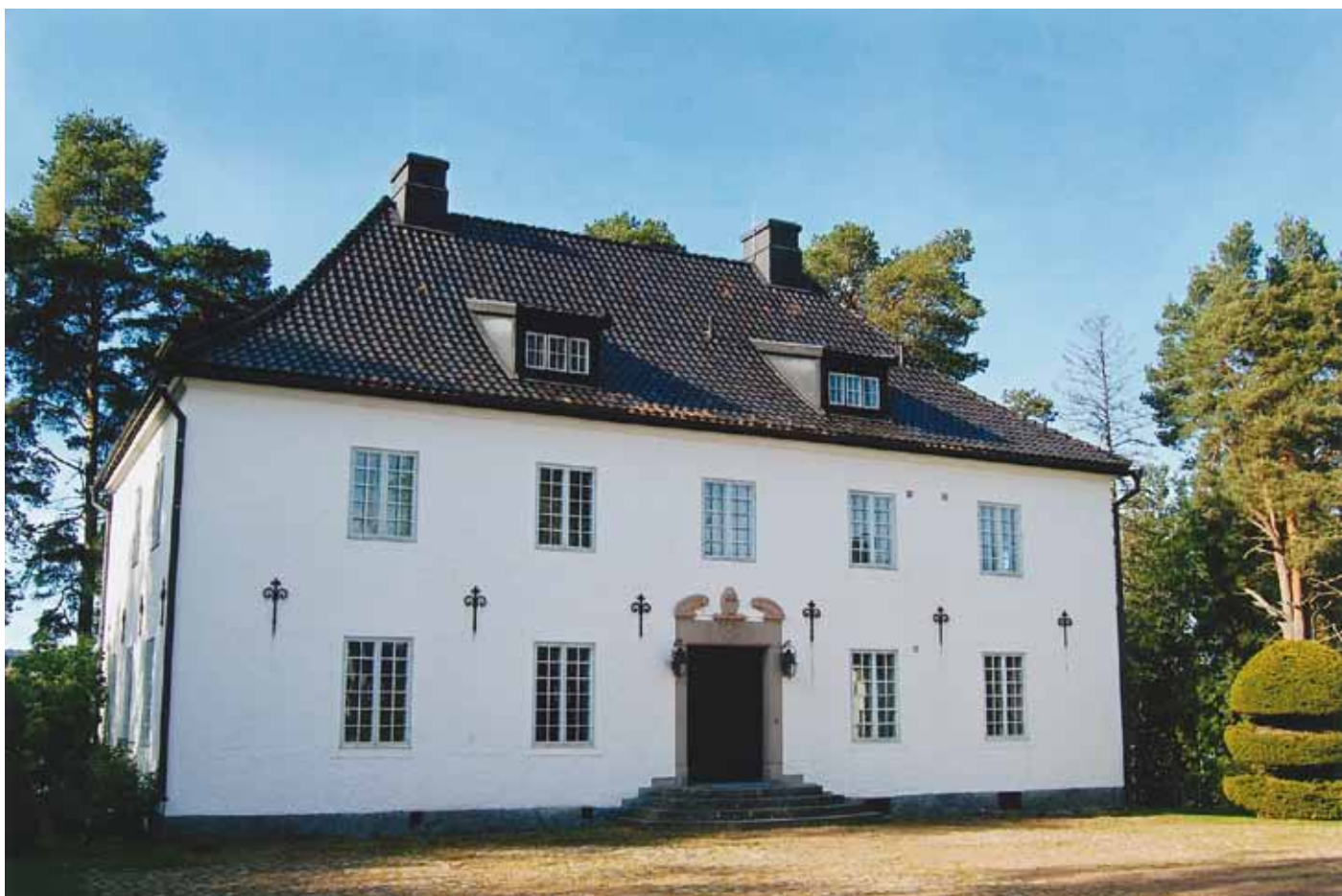
Huset är ritat av Torben Grut i Vasa-renässans-stil och blev klart 1911. Gården kallades i folkmun helt enkelt Munthes. Hildasholm var en senare benämning.

ned allt till en av flyglarna där jag fick sitta i uppvärmd lokal. Huvudbyggnaden är nämligen fortfarande utan centralvärme och blir snabbt utkyld. Huset var helt omodernt ifråga uppvärmning och elektricitet under Hildas livstid (d.1967). Inte förrän 1995 blev elektricitet indraget. Resultatet av nämnd inventering – i handskrivet manus utan backupkopior – försvann dock, blev stulet, tillsammans med övrigt bagage, av italienska tjuvar när jag var på väg till Venedig från Capri där jag hade omarbetat materialet. Dessa rader nu är alltså produkten av en ny genomgång tack vare vänligt tillstånd av de nuvarande eldsjälar som sköter Hildasholm: Christin Edström, Karin Danielsson, Ingemar Blomqvist.